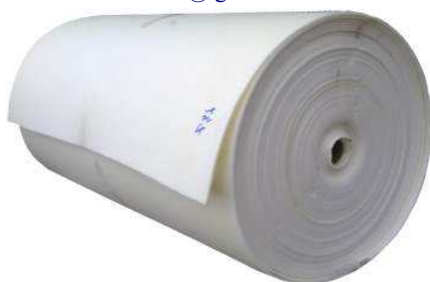
Isolon 500 рулон