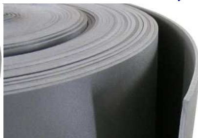
Isolon 500 серый